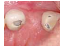
3,5 Monate post-OP Gut erhaltene Kammkontur.

Situation nach dem Einbringen von OB in die Alveole und Wundstabilisierung durch Kreuznaht. Eine Abdeckung ist nicht notwendig, durch die Zucker-vernetzte Kollagenkomponente kann OSSIX™ Bone exponiert einheilen.