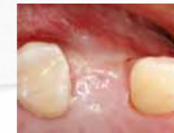
5 Monate post-OP Guter Volumenerhalt der augmentierten Region mit dicker keratinisierter Gingiva.

Abdeckung mit OSSIX® Plus Membran, spannungsfreier Wundverschluss mit absichtlich nach crestal exponierter Membran.